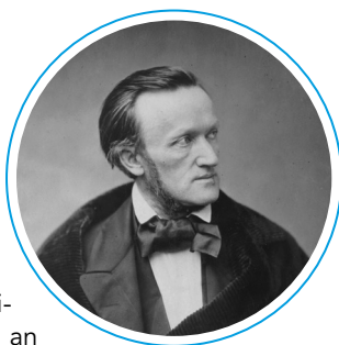
Richard Wagner vers 1860.

Années de jeunesse. Né à Leipzig, dans le Royaume de Saxe (État historique de l'actuelle Allemagne), le jeune Richard est élevé par son beau-père, peintre et poète. Fasciné par le théâtre, la poésie et la musique, il étudie l'esthétique, la philosophie ainsi que la composition. À 19 ans, il compose une symphonie et un an plus tard son premier opéra.